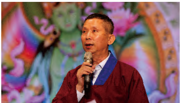
↑ 大義學會一蓮鏈講師代表致詞

啊？「大俠百草翁」聽過嗎？「三俠，白俠、紅俠、粉紅俠」還有一個，「為何命如此？天生散人，六元老和尚」，你們有看過嗎？「大俠百草翁，三俠，白俠、紅俠、粉紅俠」，還有一齣「天生散人，六元老和尚」，布袋戲啊！以後有機會我演布袋戲給你們看啊！