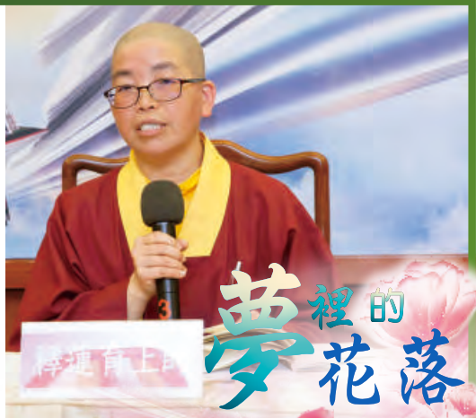
■文 / 林玲華

一〇一八年三月十七日(星期一)六,〈台灣雷藏寺〉恭請聖尊蓮生活佛主壇「大威德金剛護摩大法會」,法會前舉辦了師尊文集讀書會,下午兩點在大會議室,由釋蓮育上師導讀第一七九冊師尊文集《夢裡的花落》。