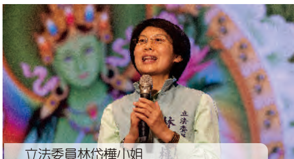
立法委員林岱樺小姐