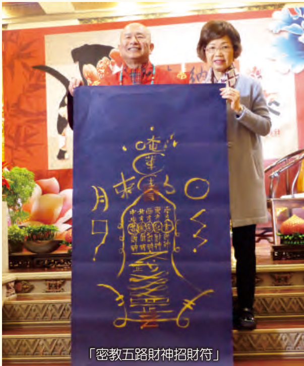
「密教五路財神招財符」