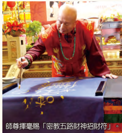
師尊揮毫賜「密教五路財神招財符」。

我只買油，因為汽車要加油；在台灣我只有買水，喝礦泉水或乾淨的水，因為台灣的水不能喝。我在西雅圖就是喝自來水，所以不用買水。