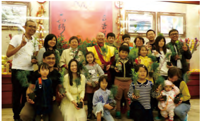
聖尊贈予現場民眾植物樹苗。