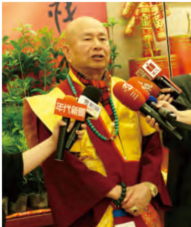
聖尊接受多家媒體採訪。