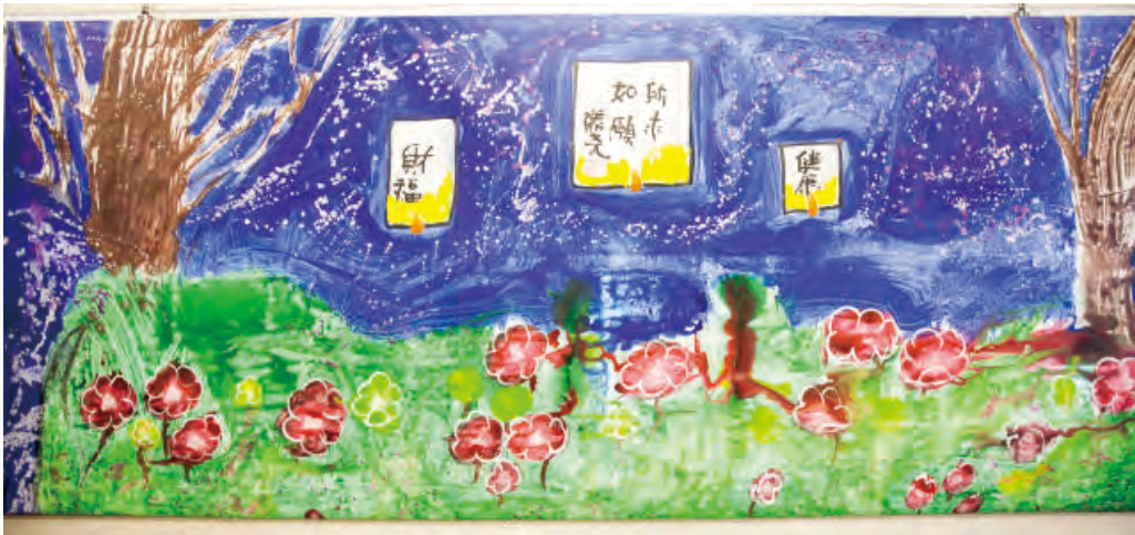
師尊創作第七幅巨型畫作「天燈」