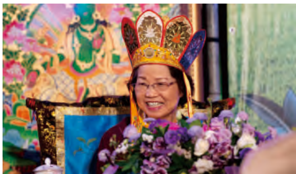
↑ 師母蓮香金剛上師