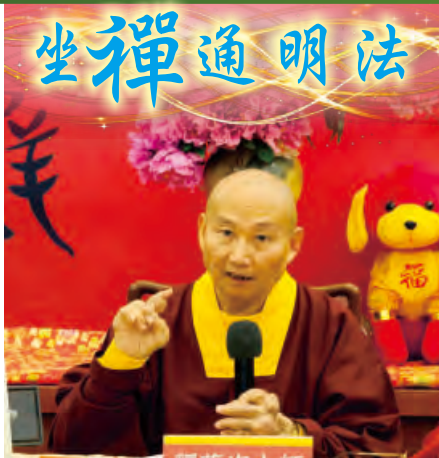
■文 / 王素琴

一〇二八年三月十日(星期六) 一 師尊親臨〈台灣雷藏寺〉主壇「摩利支天護摩大法會」。法會前，讀書會由學養豐富的釋蓮海上師擔任主講，導讀師尊文集第四五冊《坐禪通明法》。以下為導讀重點：