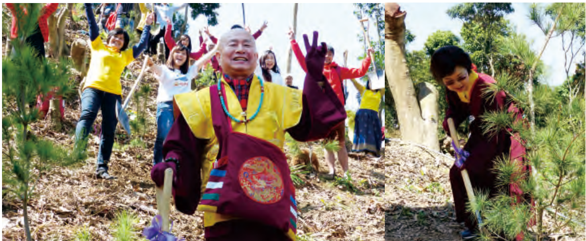
師尊偕同師母帶領眾同門於真佛大道斜坡，共同栽種松樹。

報四重恩，下濟三途苦，見佛了生死，如佛度一切。(五) 唸西方三聖咒語：「喻。阿彌爹娃。些。喻。嘛呢。唵味吽。喻。虛虛。索。梭哈。」(三遍)，祈求西方三聖現前。(六) 做「眠光法」：觀想「喻阿吽」白紅藍三光射向虛空，咒字「棒」變成一個光網罩住行者，行者睡在光明中。